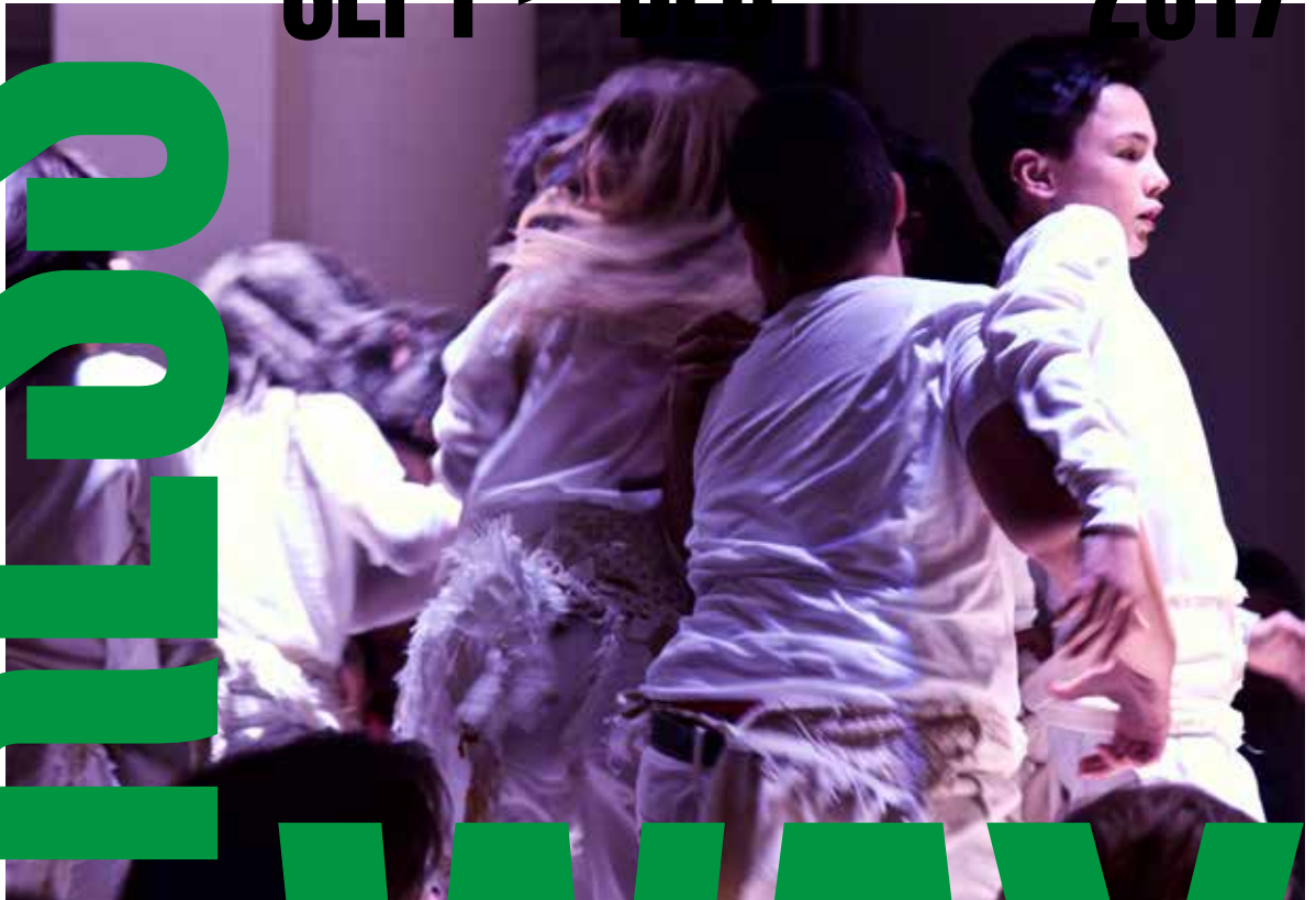
ATELIER THÉÂTRE ACTION VIDÉO